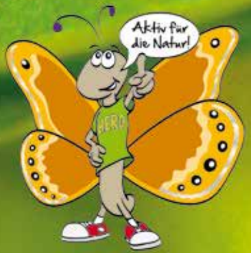
Wald-Wiesenvögelchen, Coenonympha hero : Vorbild für das LPV-Maskottchen „Hero“