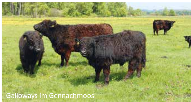
Galloways im Gennachmoos

Wenn Sie unsere Heimat auf eigene Faust erkunden wollen, sind die Weideprojekte des LPV genau das Richtige: Zu jeder Jahreszeit sind unsere Galloways im ehemaligen Niedermoorgebiet in Gennach oder unsere imposanten Auerochsen im Thierhauptener Brunnenwasser einen Besuch wert!